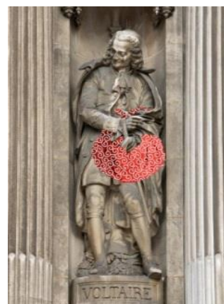
石像インスタレーション イメージ

市庁舎前パビリオンを覆う唐草模様と同じ色であり、日本の伝統色でもある臙脂色(えんじいろ)をプロジェクトカラーとし、シンプルで印象に残りやすいロゴを作成しました。