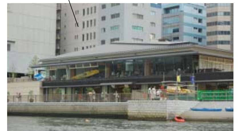
八軒家浜の「川の駅『はちけんや』」