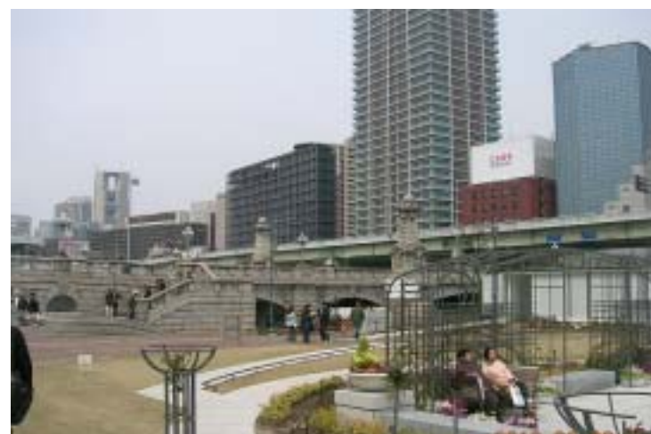
整備された中之島公園(バラの広場付近)