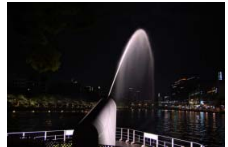
中之島公園剣先地区の大噴水