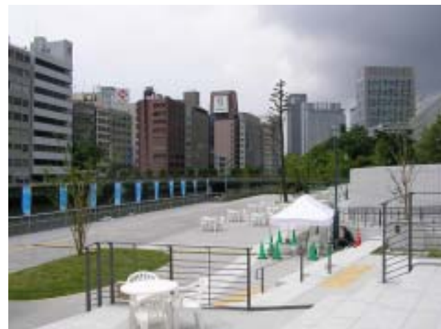
整備された川辺のテラス(中央公会堂付近)