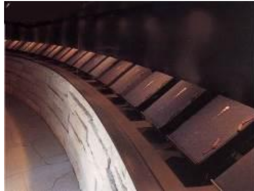
祈念碑の内部(名簿三十五巻所蔵)