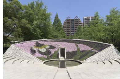
(参考：令和3年度春花壇)

1 応募資格 都内在住、在学の児童・生徒（小学校・中学校・高等学校・特別支援学校）