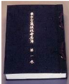
東京空襲犠牲者名簿(第一巻)

扇形 面積 110㎡ 斜度 30度 大きさ/幅 18.4m、奥行 8.5m、最大高 4.5m