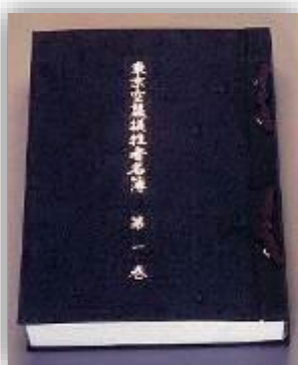
東京空襲犠牲者名簿(第一巻)