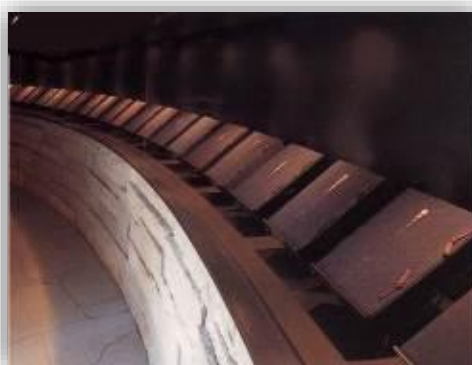
祈念碑の内部(名簿三十五巻所蔵)