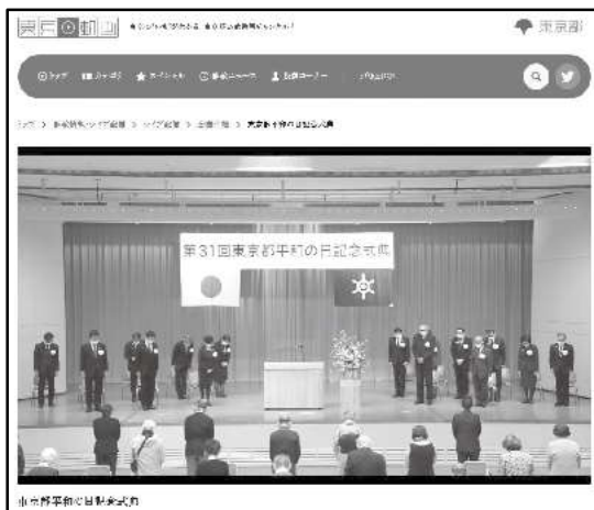
東京動画 3月10日から翌年3月9日まで掲出