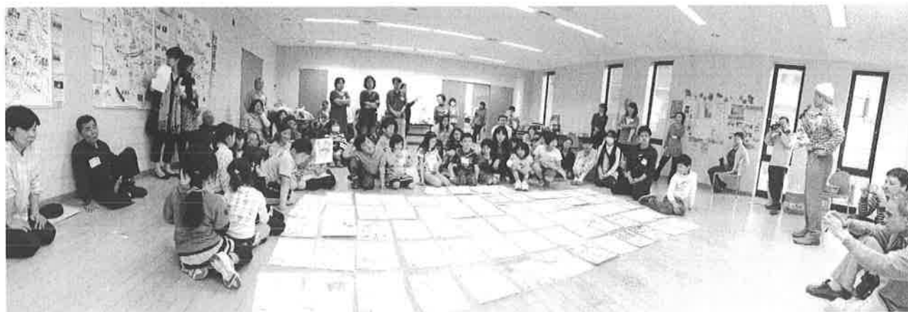
かるた de くるめの様子

モデル事業終了前の3月30日に開催した拡大協議会において、これまでの振り返りとともに、改めて今後に向けての基本的な方向の確認を行い、市民つながり隊参加者からも想いを共有する発言が続いたのは、東久留米を楽しく、元気にしたいとの強い気持ちがあったことの証左と言えよう。