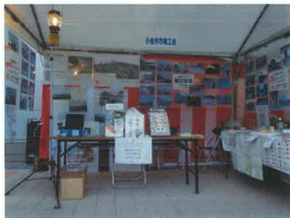
写真パネルを掲示した本部テント