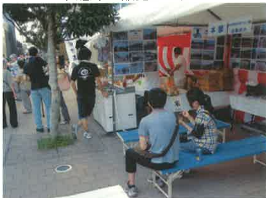
協議会のコーナー