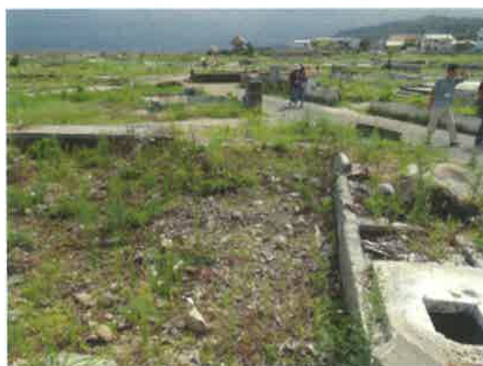
1年以上も風景が変わらない久之浜地区