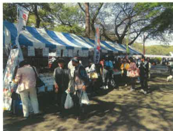
天候に恵まれた市民まつり