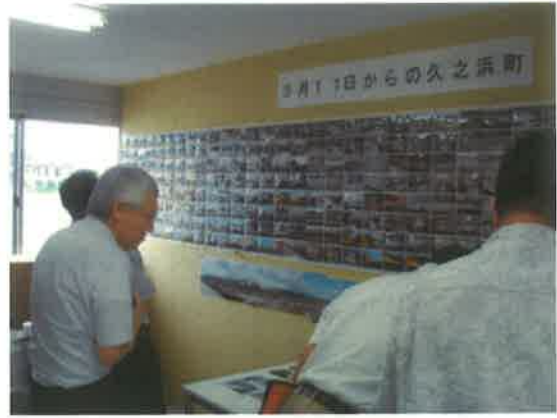
商店街にある展示室