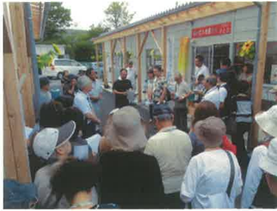
浜風商店街の話を伺う