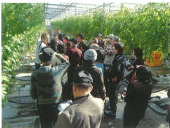
トマトランドいわき