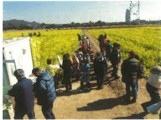
菜な畑ロードでのひととき