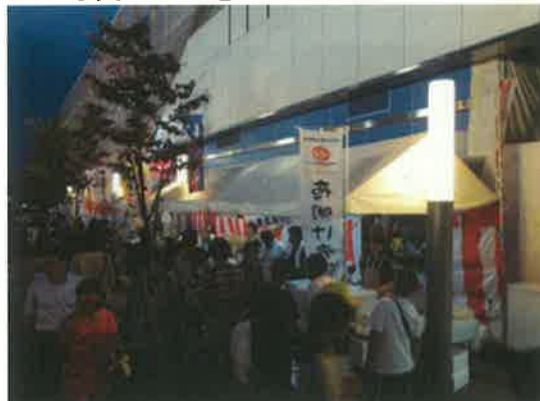
2日間にわたり多くの人出があった

ウ)「夜明け市場 in KOGANEI」の第40回小金井なかよし市民まつりでの実施状況