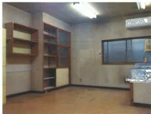
店舗奥の倉庫兼作業スペース