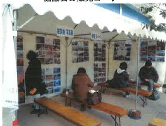
パネルを配した休憩コーナー