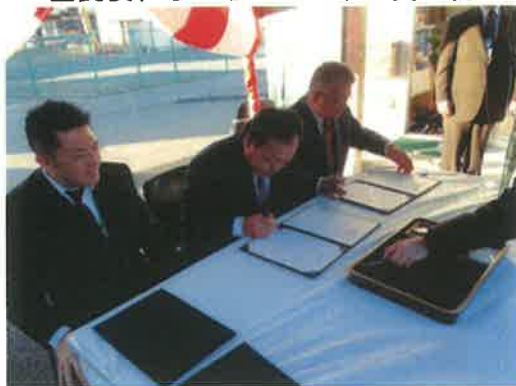
浜風商店街との交流協定の調印