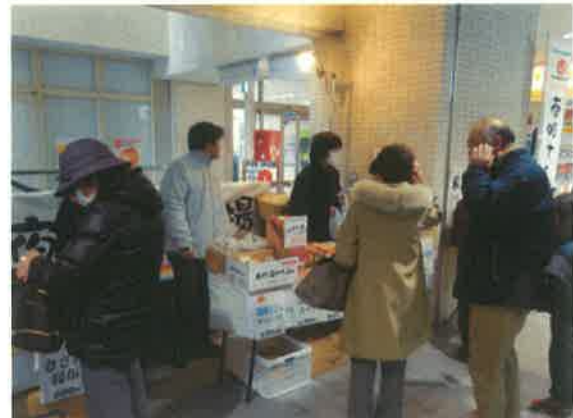
2/11 の協議会のコーナー