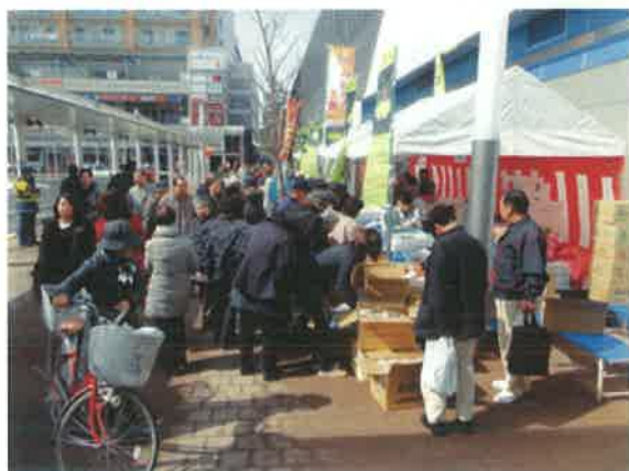
鴨川市のコーナー