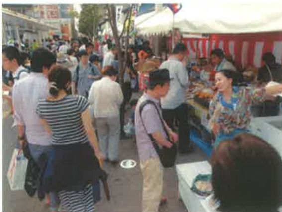
阿波踊りにあわせて開催した「夜明け市場」