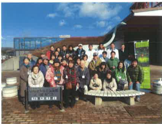
「ほるる」前での集合写真