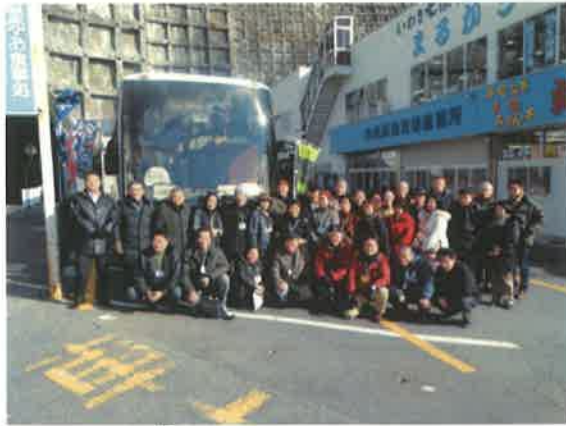
昼食後の集合写真（いわき市）