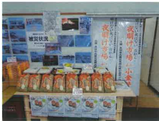
いわき産コシヒカリのコーナー