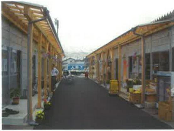
仮設の浜風商店街