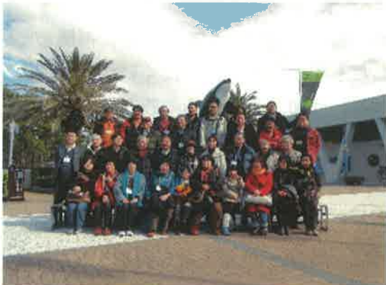
鴨川シーワールド前で