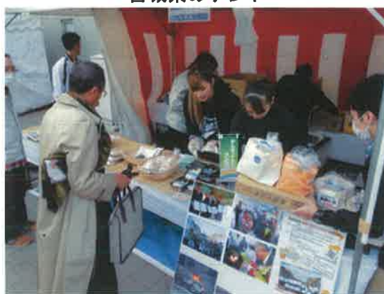
いわき市のコーナー