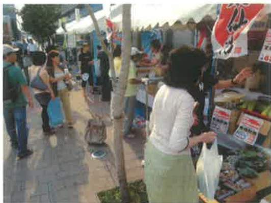
久慈市の販売コーナー