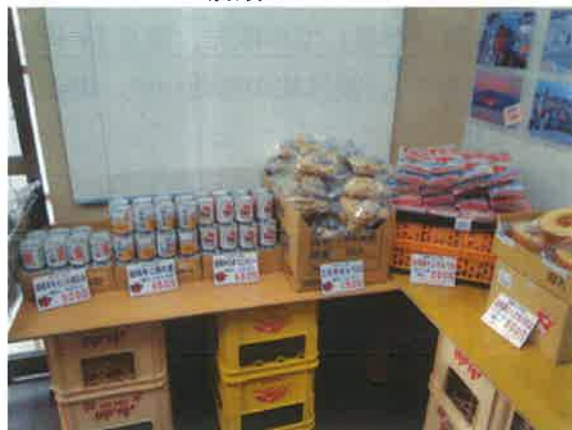
久慈市の商品コーナー