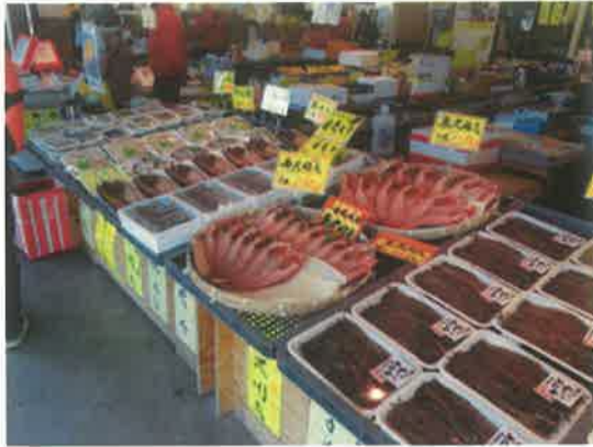
P 昼食後、ら・ら・ミュウで買い物