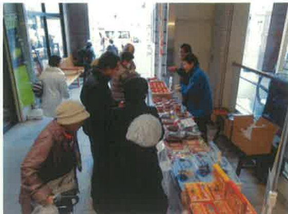
2/11 のいわき市コーナー