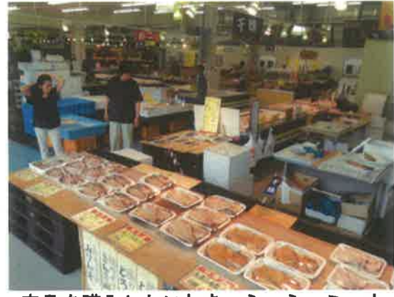
産品を購入したいわき・ら・ら・ミュウ