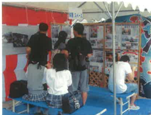
写真パネルを配した休憩スペース