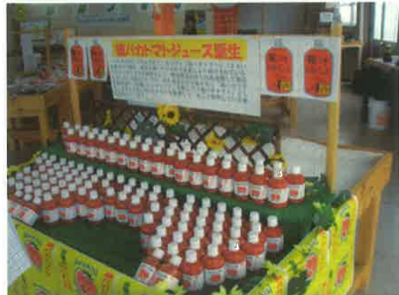
親バカトマトジュースのコーナー