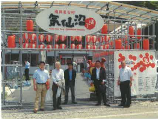
復興屋台村気仙沼横町前