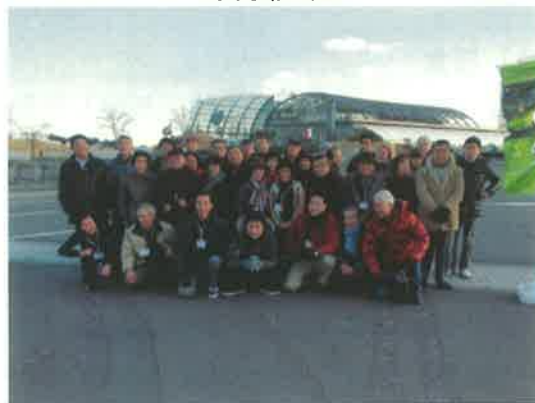
アクアマリンふくしまでの集合写真