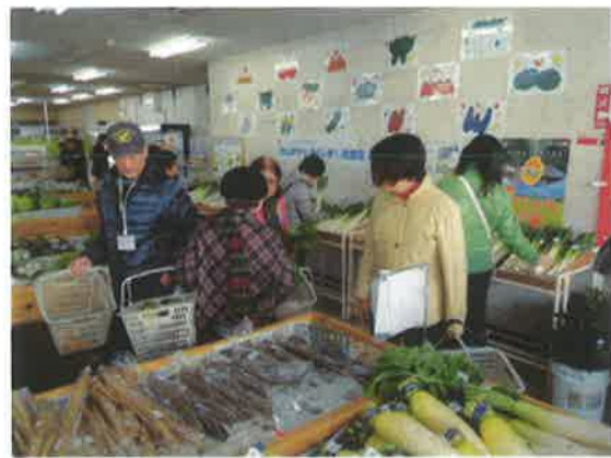
やさい館で産品を購入