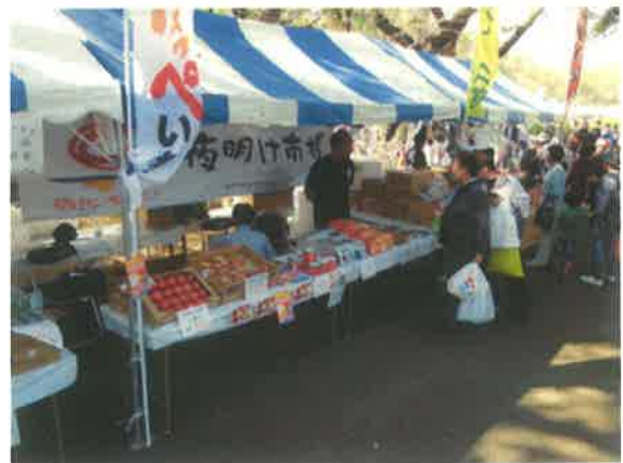
市民まつりに出店した「夜明け市場」