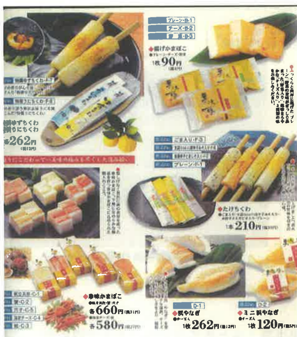
いわき市から提示された産品一覧のサンプル

被災地の産物、産品を扱う業者等との交渉、連携により、定期的に仕入れを行った。仕入れ先は、被災地各地の商工会等を通じてリストアップを行い、調査等を経て選定、交渉に入った。