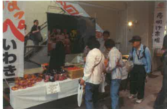
いわき市コーナー