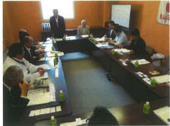
久慈市商工会議所での会議