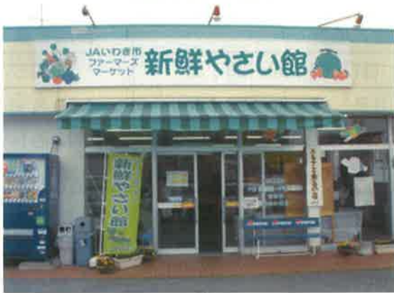
ファーマーズマーケット