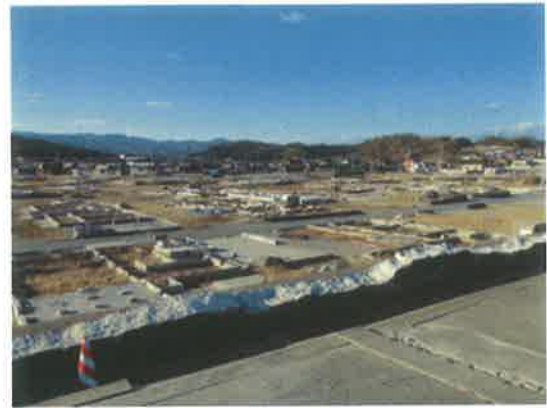
風景が変わらない久ノ浜地区