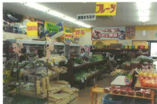
観光物産館1階店内