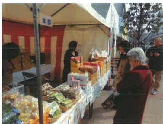
協議会の販売コーナー

今後も活動を継続すること、交流協定締結をさらに広げていきたいことをみなさんに 伝え、またの再会を約束して2日間の「夜明け市場」を終えた。