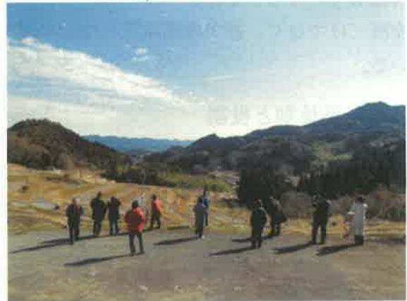
大山千枚田（鴨川市）