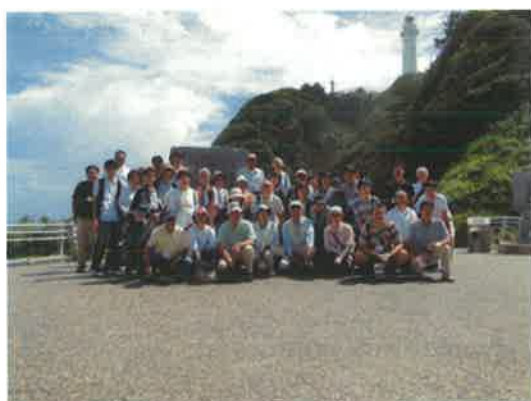
塩屋崎での集合写真