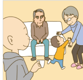
じいじとばあばが遊んでくれるのは