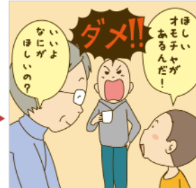
まあ非常に助かるのですが