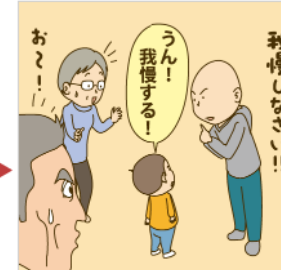
何回お願いをしても