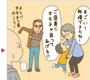
なにかと理由をつけてオモチャを上げたがります。