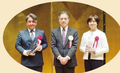
令和5年度受賞企業の皆様