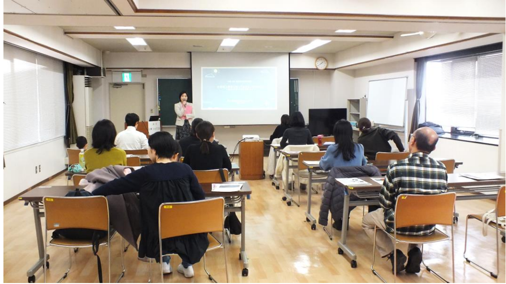
男女共同参画講座「小学校入学前に知っておきたい大切なこと～仕事と子育ての両立のポイント～」