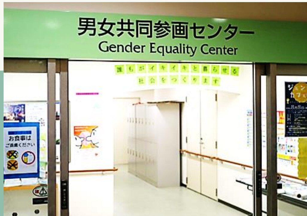
男女共同参画センター「ゆーあい」

多様な世代が集まる 3 館複合施設の「武蔵村山市立緑が丘ふれあいセンター」 令和 6 年度来館者数：約88,000人