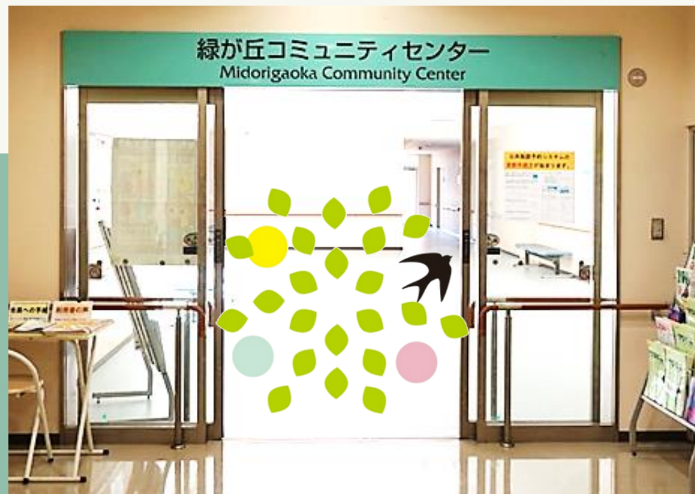
緑が丘コミュニティセンター

男女共同参画社会の形成促進に関する情報及び学習機会の提供、相談事業などを行っています。