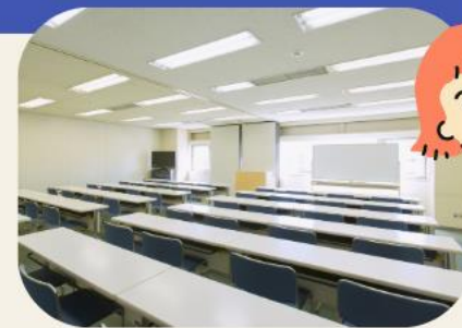
団体の会議や学習会などに使える研修室