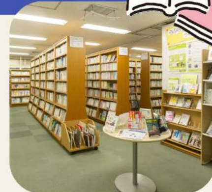
本や漫画、DVD等があるライブラリー