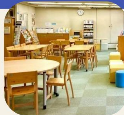
グループ活動ができる情報・交流コーナー