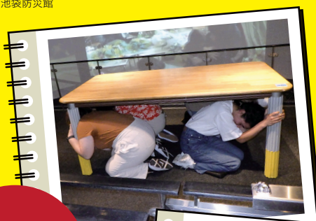
Trải nghiệm động đất