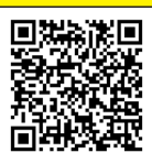
Form đăng ký