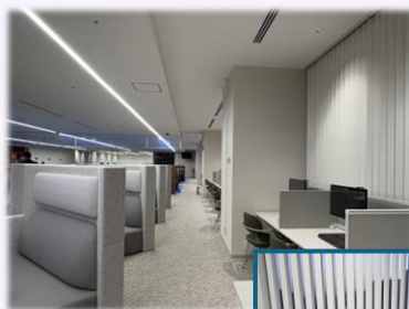
映像ライブラリー