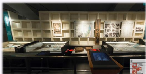
「空襲と都民」コーナーイメージ (リニューアル前)