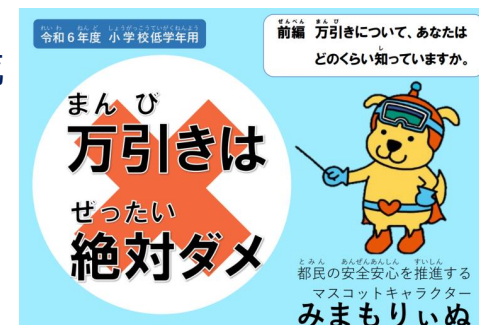
令和6年度版補助資料