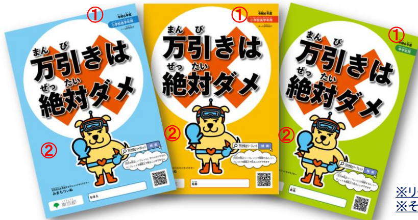
※リーフレット写真は令和6年度版です。 ※その他、所要の修正を加えることができます。