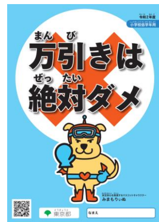
令和2年度版リーフレット