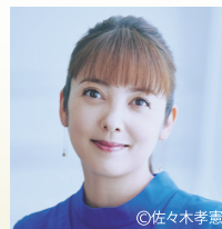
パネリスト 中山 エミリ 氏 タレント