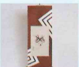
江戸表具 前川治 前川十仁