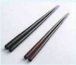
江戸木箸 竹田勝彦 丸川徳人