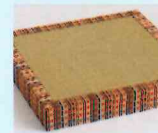
有職畳 小宮太郎 加藤元靖