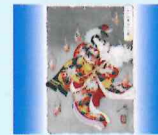
木版画彫 永井沙絵子