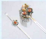
鋳かんざし 三浦孝之