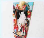
押絵羽子板 西山鴻月