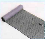
江戸小紋・江戸更紗 中條隆一 中條康隆