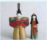
江戸木目込人形 塚田詠春 塚田真弘