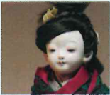
市松人形 藤村光環 藤村紫雲