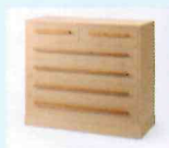
桐たんす 田中英二