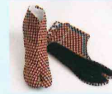
足袋仕立て 石井芳和 石井健介