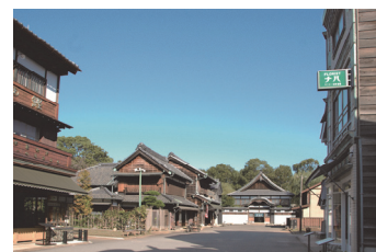
江戸東京たてもの園 下町中通りの街なみ