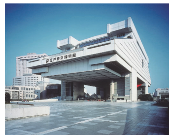
東京都江戸東京博物館外観

収蔵建造物の範囲は、本館の博物館資料と同様に、時代的には近世初頭から現代までを中心とし、地域的にはおおむね現在の東京都全域とする。