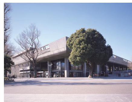
東京文化会館外観

東京都が開都500年記念事業として建設。都民に音楽・バレエ等の鑑賞の機会を提供するとともに、次世代の輝きと可能性を感じ育てる場とすることを目的として東京