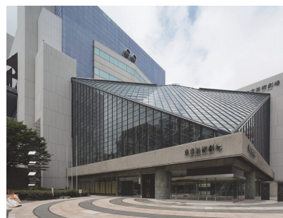
東京芸術劇場外観