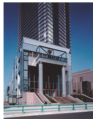
東京都写真美術館外観