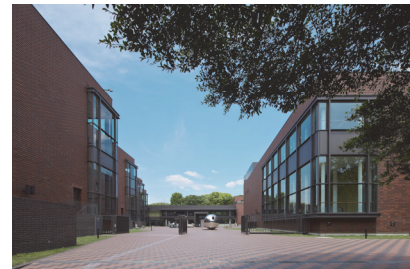
東京都美術館外観