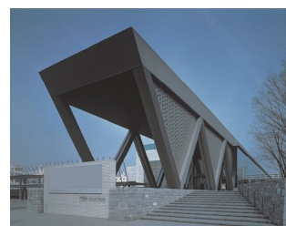
東京都現代美術館外観