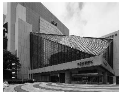
東京芸術劇場外観