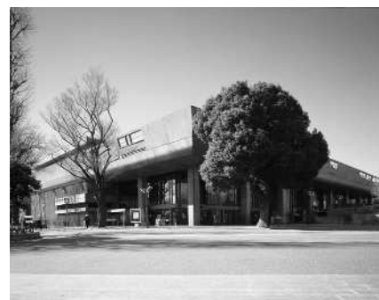
東京文化会館外観