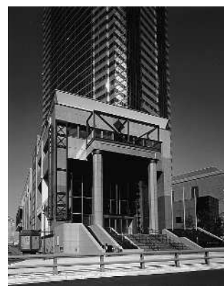
東京都写真美術館外観