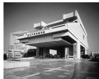
東京都江戸東京博物館外観

江戸東京の文化を保存し次代に継承するとともに、江戸東京の歴史を振り返り、これからの東京の都市と生活を考える場として東京都江戸東京博物館を設置し、運営している。