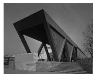
東京都現代美術館外観

都民が優れた現代美術を中心とする美術作品に接する場として、また創造・交流活動の場として、東京都現代美術館を設置し、運営している。