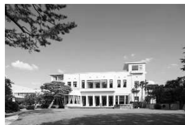
東京都庭園美術館外観

東京都庭園美術館は、昭和8年に朝香宮邸として建てられた建物を活用し、緑豊かで広大な庭園とアール・デコ様式の建物、美術作品とを合わせて鑑賞できる都民の憩いの場として開館した。平成27年7月に、旧朝香宮邸4棟1基が国の重要文化財（建造物）として指定された。令和3年4月1日より東京都庭園美術館条例を施行。