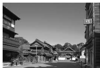
江戸東京たてもの園 下町中通りの街なみ

現地保存が不可能な文化的価値の高い歴史的建造物を移築し、復元、保存・展示した野外博物館である。収蔵建造物を貴重な文化遺産として次代に継承するとともに、建造物内部での生活民俗資料等の展示や、街なみの一端を再現することにより、変遷する建築文化や生活文化への都民の理解に資するために設置し、運営している。