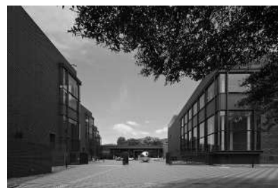
東京都美術館外観