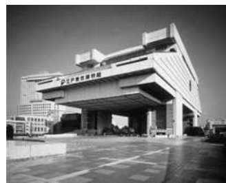
東京都江戸東京博物館外観

江戸東京の文化を保存し次代に継承するとともに、江戸東京の歴史を振り返り、これからの東京の都市と生活を考える場として東京都江戸東京博物館を設置し、運営している。