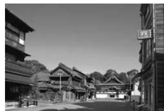
江戸東京たてもの園 下町中通りの街なみ

現地保存が不可能な文化的価値の高い歴史的建造物を移築し、復元、保存・展示した野外博物館である。収蔵建造物を貴重な文化遺産として次代に継承するとともに、建造物内部での生活民俗資料等の展示や、街なみの一端を再現することにより、変遷する建築文化や生活文化への都民の理解に資するために設置し、運営している。