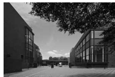
東京都美術館外観