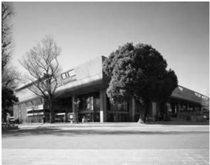
東京文化会館外観

都が開都500年記念事業として建設。都民に音楽・バレエ等の鑑賞の機会を提供するとともに、次世代の輝きと可能性を感じ育てる場とすることを目的として東京文化会館を設置し、運営している。