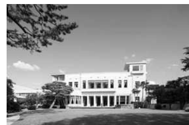
東京都庭園美術館外観

東京都庭園美術館は、昭和8年に朝香宮邸として建てられた建物を活用し、緑豊かで広大な庭園とアール・デコ様式の建物、美術作品とを合わせて鑑賞できる都民の憩いの場として開館した。平成27年7月に、旧朝香宮邸4棟1基が国の重要文化財(建造物)として指定された。令和3年4月1日より東京都庭園美術館条例を施行。