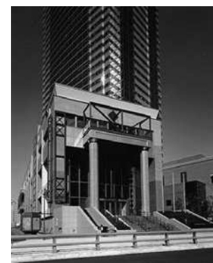
東京都写真美術館外観