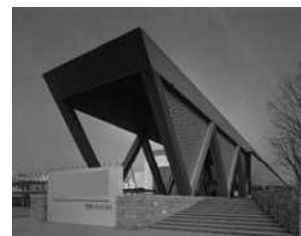
東京都現代美術館外観