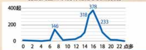
《侵犯儿童生命、身体的犯罪发生情况》