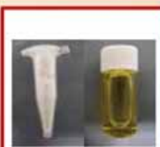
Thuốc nguy hiểm