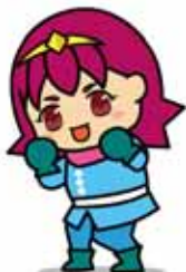
can đảm TOAN