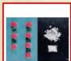
Chất kích thích

Khi sử dụng “Ma túy”, những cơ quan nội tạng quan trọng như não, thần kinh, tim, v.v... sẽ bị tổn thương, cơ thể sẽ xuất hiện nhiều rối loạn. Sẽ bị ngộ độc thuốc, có thể dẫn đến tử vong.