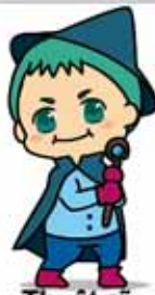
Thuật sĩ SHIN