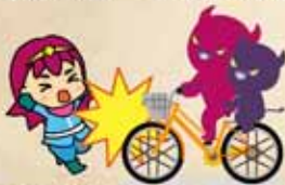
【兩人坐一輛自行車】