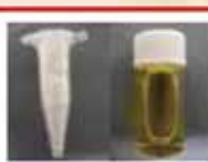
खतरनाक लागु औषधि

जापानमा लागुऔषध प्रयोग गर्नु, राख्नु, दिनु वा लिनु अपराध [कानूनमा तोकिएको खराब काम] हो।