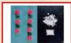
उत्तेजक औषधि या लागुपदार्थ

यदि तपाईं "लागु औषधि" प्रयोग गर्नुभयो भने मुटु र शरीरलाई विभिन्न क्षति हुनेछ। शरीरका विभिन्न समस्या निस्किएर सबैभन्दा खराब अवस्थामा मर्न पनि सकिन्छ।