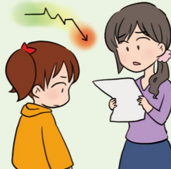
急に学力が低下した