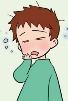
いつも眠そうだったり、脱力感が見受けられたりする