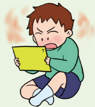
ゲームに夢中になっている