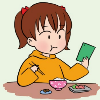
食事中も、ずっとスマホを見たり、操作したりしている