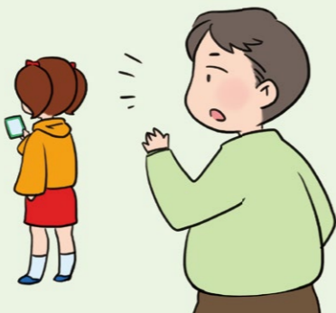
あまり会話をしなくなった